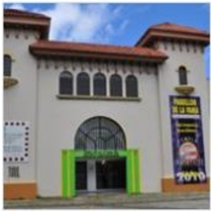
Pabellón de la Fama del Deporte Puertorriqueño