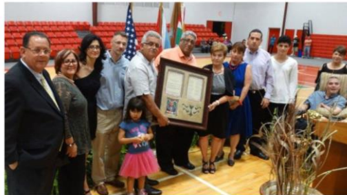
Jayuya con Salón de la Fama del Deporte