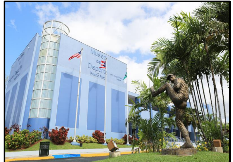
Museo Del Deporte De Puerto Rico Guaynabo, PR

¡Y asegúrate que la mujer deportista este representada!