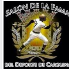
Salon de la Fama del Deporte de Carolina